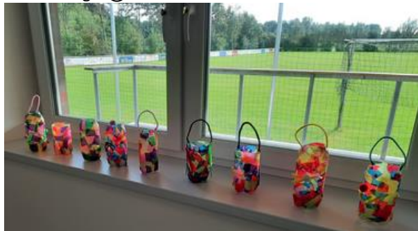
Nadine und Frissy