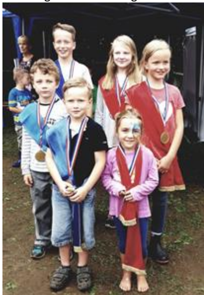
Königinnen und Könige 2017