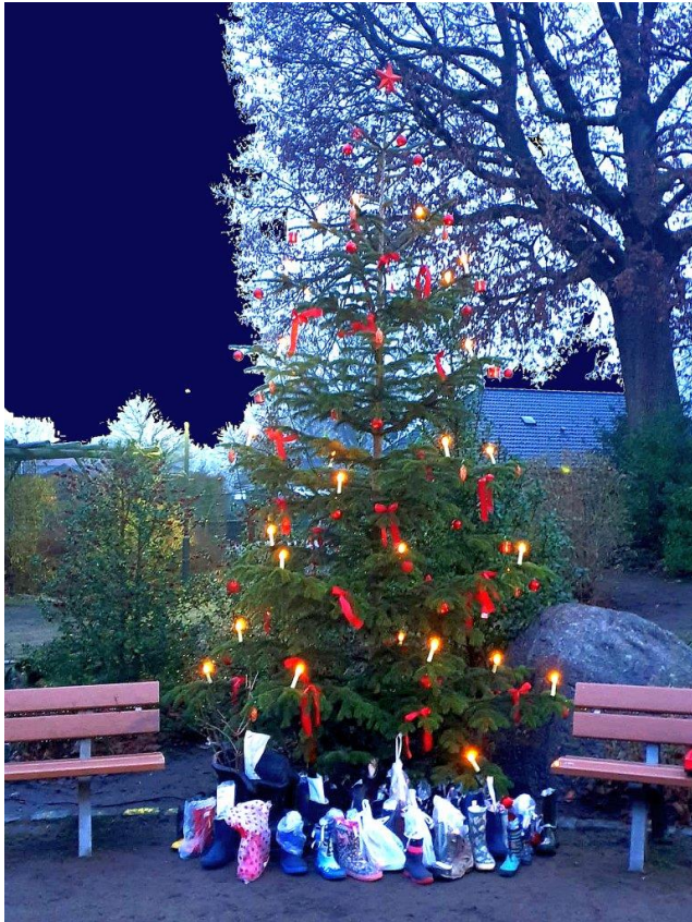
Unser Weihnachtsbaum in der Dorfmitte mit 53 Nikolausstiefeln