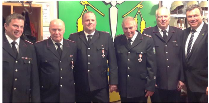
Bürgermeister, neuer Wehrführer, Stellvertreter und Geehrte